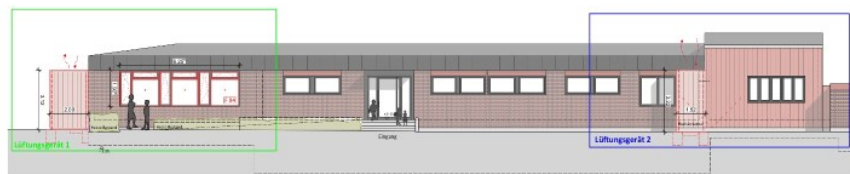
Ansicht Nord 1:100