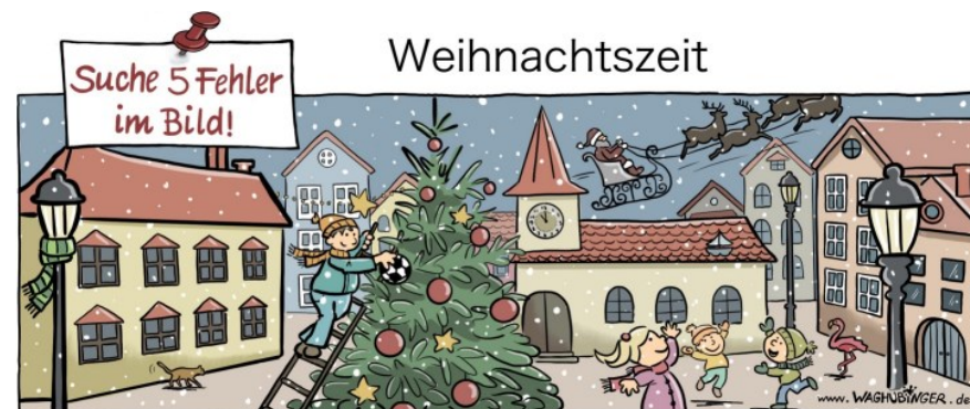
Schal an der Laterne, Fubball, Nikolaus, Flamingo